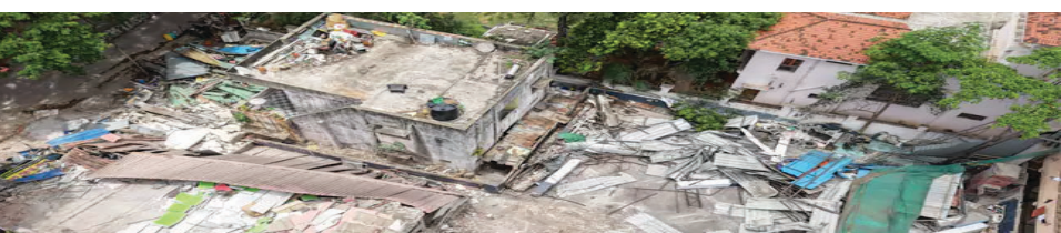
తెలియకుండా చుట్టూ ఉన్న ప్రభుత్వ, ప్రజావసరాల కోసం ఉద్దేశించిన స్థలాలను అక్రమించిన కట్టడాదారుడు.. హోటల్, హాస్టల్ కు అద్దెక్కిచ్చి నెలకు రూ.10 లక్షలు

హైదరాబాద్: జుబ్లీహిల్స్ లో దాదాపు రూ.200 కోట్ల విలువ చేసే రెండేకరాల పార్క్ స్థలాన్ని అక్రమణదారుల చెర నుంచి హైద్రా విడిపించింది. జుబ్లీహిల్స్ రోడ్ నంబర్ 41 పెద్దమగ్గుడి సమీపంలో నాలాతో పాటు పార్క్ రహదారిని అక్రమించి నిర్మించిన భవనాలను హైద్రా సిబ్బంది నేలమట్టం చేశారు. ఇంటిని అడ్డకు తీసుకొని ఆ ఇంటి యజమానికి