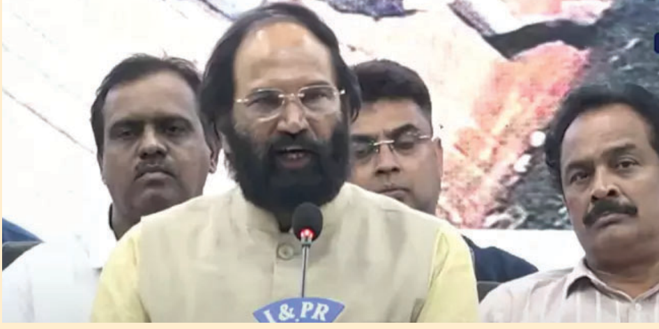
డీపీఆర్ లో పేర్కొన్న ప్రదేశం కాకుండా మరోచోట ప్రాజెక్టు కట్టారు. నాలుగు రెట్లు వ్యయం పెరిగిన ప్రాజెక్టుతో అదనపు ఆయకట్టు నామమాత్రంగా పెరిగింది. కేవలం కమిషన్ కోసమే ప్రాజెక్టు ప్రాంతం మార్చారు. కాళేశ్వరం తెల్ల ఏనుగుగా

ముందు విచారణకు హాజరయ్యారని గుర్తు చేశారు. నోటీసులు ఇచ్చాక జ్యూడిషియల్ కమిషన్ కిందపరిచేలా మాట్లాడుతున్నారని విమర్శించారు. చట్టపరమైన చర్యలు తీసుకునేందుకే జ్యూడిషియల్ కమిషన్ వేసామన్నారు. “బాంబులు వేశారని చెబుతున్నారు.. అప్పుడు మీరే ప్రభుత్వంలో ఉన్నారు. మేడిగడ్డపై బాంబులు వేస్తే అప్పుడు ఎఫ్ఐఆర్ లో ఎందుకు పేర్కొనలేదు. కాళేశ్వరం ప్రాజెక్టును తెల్ల ఏనుగుతో పోల్చుతూ కాంగ్రెస్ నివేదికలో పేర్కొంది. భారాన నేతలు జేబులు నింపుకోనేందుకు మేడిగడ్డ ప్రాజెక్టు ప్రాంతం మార్చారు.