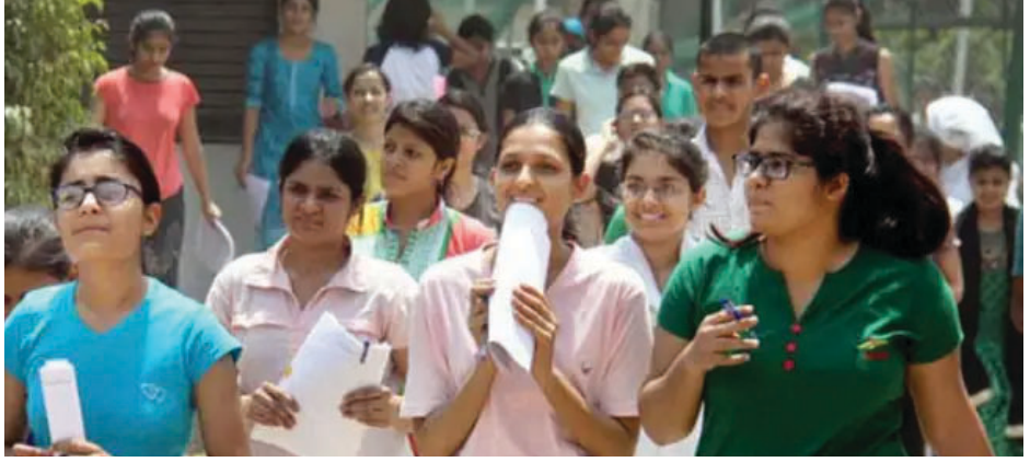
2025కు 92.64% మంది హాజరైన 1,06,716 మంది దరఖాస్తు చేసుకోగా విషయం తెలిసిందే. దీనికి మొత్తంగా వారిలో 98,858 మంది పరీక్ష రాశారు.