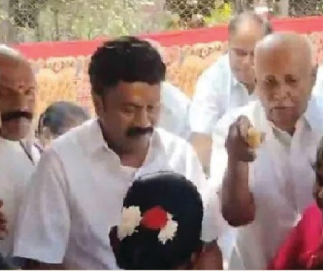
కాలంలో సుమారు 70 రోజుల పాటు నిరంతరంగా పేదలకు రుచికరమైన భోజనాన్ని అందిస్తుండటంపై తలసాని హర్షం వ్యక్తం చేశారు. "ఉద్యోగ విరమణ చేసిన తర్వాత విశ్రాంతి తీసుకోకుండా, సమాజానికి

హైదరాబాద్ : ఆకలితో అలమటిస్తున్న నిరుపేదలకు అండగా నిలవడాన్ని మించిన గొప్ప కార్యం మరొకటి లేదని సనత్ నగర్ బీఆర్ఎస్ ఎమ్మెల్యే తలసాని శ్రీనివాస్ యాదవ్ అన్నారు. సనత్ నగర్ పరిధిలోని బీకే గూడ పార్క్ వద్ద 'శ్రీనివాస సమాజ సేవ వారిటబుల్ ట్రస్ట్' ఆధ్వర్యంలో ఏర్పాటు చేసిన ఉచిత మధ్యాహ్న భోజన పంపిణీ కేంద్రం, చలివేంద్రాలను ఈరోజు ఆయన ప్రారంభించారు. ఈ సందర్భంగా ఆయన మాట్లాడుతూ... సేవ చేయాలనే సంకల్పం ఉన్న సీనియర్ సిటిజన్లను ఆయన మనస్ఫూర్తిగా అభినందించారు. 2011 నుంచి ప్రతి ఏటా వేసవి