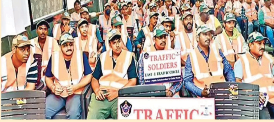
ఈ ట్రాఫిక్ సోల్డర్స్ ప్రధానంగా నగరంలోని రద్దీ కూడళ్లు, అనుపత్రులు, మార్కెట్ల వద్ద ట్రాఫిక్ నియంత్రణపై దృష్టి పెడతారు. సిగ్నల్ జంపింగ్, రాంగ్ రూల్ లో డ్రైవింగ్, ర్యామ్ డ్రైవింగ్, తప్పుడు ప్రదేశాల్లో పార్కింగ్ వంటి నిబంధనల ఉల్లంఘనలను గుర్తించారు. అయితే, జరిమానాలు విధించకుండా, వాహనదారులకు సున్నితంగా నచ్చజెప్పి, నిబంధనలపై అవగాహన కల్పిస్తారు. హెల్మెట్, సీట్ బెల్ట్ ధరించని వారికి, డ్రైవింగ్ లో మొబైల్ ఫోన్ వాడేవారికి రహదారి భద్రత ప్రాముఖ్యతను వివరిస్తారు. రద్దీ ప్రాంతాల్లో రోడ్డు దాటడానికి ఇబ్బంది పడుతున్న వృద్ధులు, పిల్లలకు సహాయం చేయడం కూడా వీరి బాధ్యతల్లో ఒకటి. పండుగలు, ర్యాలీలు, వీణపీల పర్వాల సమయంలో ట్రాఫిక్ పోలీసులకు చేదోడు వాడేడుగా ఉంటారు. స్వయంగా రంగంలోకి దిగిన సీపీ ఈ కార్యక్రమం కోసం పోలీసులు నగరంలోని యువతతో మాట్లాడి, ట్రాఫిక్ నియంత్రణలో వారి పాత్ర ఎంత కీలకమో వివరించారు.

విశాఖపట్నం : నగరంలో ట్రాఫిక్ నియంత్రణ, ప్రమాదాల నివారణ లక్ష్యంగా పోలీసులు ఓ విచిత్ర కార్యక్రమానికి శ్రీకారం చుట్టారు. 'ట్రాఫిక్ సోల్డర్స్' పేరుతో పౌర భాగస్వామ్యునికి పెద్దపీట వేస్తూ సరికొత్త విధానాన్ని అమలులోకి తెచ్చారు. నగరంలో పెరుగుతున్న ట్రాఫిక్ ఒత్తిడిని తగ్గించి, ప్రజలలో రహదారి భద్రతపై అవగాహన పెంచేందుకు ఈ కార్యక్రమాన్ని రూపొందించారు. ఇందులో భాగంగా ఆసక్తి కలిగిన 206 మందిని ఎంపిక చేసి, వారికి ప్రత్యేక శిక్షణ ఇచ్చి విధుల్లోకి తీసుకున్నారు. ఈ నెల 16 నుంచి వీరు నగరంలోని 21 ట్రాఫిక్ పోలీస్ స్టేషన్ల పరిధిలో సేవలు అందిస్తున్నారు. ట్రాఫిక్ సోల్డర్స్ విధులు ఇవే