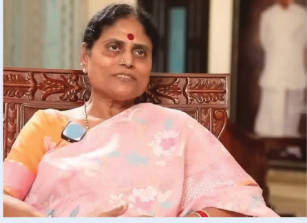
డివిడెండ్ మాత్రమే). ఆస్తులు విషయంలో జగన్ తన మేనల్లుడికి, మేనకోడలికి ఇప్పటివరకు అన్యాయం చేశాడు. ఎప్పటికైనా న్యాయం చేస్తాడని తన తల్లిగా ఆశిస్తున్నాను. ఆస్తుల పంపకం జరగలేదు. షర్మిలకు ఇచ్చినటువంటి ఆస్తుల లాంటివే వైఎస్సార్ గారు జగన్ కు కూడా ఇచ్చారు. అది ఆస్తి పంపకం కాదు. నిజం ఏమిటో నా దేవుడికి, నా కొడుకుకి కూడా తెలుసు. గోబెల్స్ ప్రచారం చేయడానికి మీరు ఎవరు? మీరు ఎంత కాదన్నా దేవుడి న్యాయమే న్యాయం. అసత్యాల ప్రచారం మానుకోవాలని వైఎస్సార్ భార్యగా చేతులు జోడించి అడుగుతున్నాను. మళ్ళీ మళ్ళీ మీడియాలో ప్రస్తావించొద్దని వేడుకుంటున్నా. దేవుని సాక్షిగా నేను రాసినవన్నీ వాస్తవాలు మాత్రమే" అంటూ విజయమ్మ తన నోటర్ లో పేర్కొన్నారు.

హైదరాబాద్ : మాజీ ముఖ్యమంత్రి వైఎస్ జగన్మోహన్ రెడ్డి, ఆయన సోదరి, ఏపీ కాంగ్రెస్ అధ్యక్షురాలు వైఎస్ షర్మిల మధ్య గత కొంతకాలంగా కొనసాగుతున్న ఆస్తుల వివాదం మరోసారి తీవ్ర చర్చనీయాంశంగా మారింది. ఈ వ్యవహారంపై వారి తల్లి వైఎస్ విజయమ్మ స్వయంగా స్పందించారు. కుటుంబ ఆస్తుల పంపకాలపై పూర్తి స్పష్టతనిస్తూ ఆమె ఓ అడ్వోకేట్ నోటర్ విడుదల చేశారు. ఆ నోటర్ సోషల్ మీడియాలో వైరల్ అవుతోంది. ఈ లేఖలో ఆమె తన కుమారుడు జగన్ తీరుపై తీవ్ర ఆవేదన వ్యక్తం చేయడం గమనార్హం. "2009లో వైఎస్ రాజశేఖర రెడ్డి గారి మరణం వరకున్న ఆస్తులన్నీ కుటుంబ ఆస్తులే. ఆస్తుల పంపకం ఎప్పుడూ జరగలేదు. అన్ని ఆస్తులను నలుగురు మనుమలకు సమానంగా పంచాలని వైఎస్సార్ ఉద్దేశం. ఇది ఆయన ఆదేశం కూడా. దగ్గర వాళ్ళందరికీ తెలిసిన వాస్తవమిది. ఎంపీయూలో షర్మిలకు రాసిన ప్రతి ఆస్తి న్యాయంగా ఆమెకు చెందాలి నవే. అందుకే జగన్ ఎంపీయూ రాశాడు (నిజానికి తనకు తప్పే రాశాడు. సరస్వతి సిమెంట్ తో సహా ఎంపీయూలో లీని యెలహంక ల్యాండ్ కూడా షర్మిలదే. ఇచ్చాను అని చెప్పి దబ్బా షర్మిల వాటాకు ఇచ్చిన