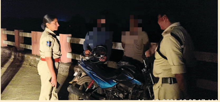
130 ఓంటరి/నిర్జన ప్రదేశాలు గుర్తించి తనిఖీ నిర్వహించారు. ఓపెన్ డ్రైకింగ్ లో పట్టుబడిన 37 మంది పై కేసులు నమోదు చేయడం జరిగిందన్నారు. మహబూబాబాద్ జిల్లా ఎస్పీ డా.

మహబూబాబాద్ జిల్లా ప్రతినది, ప్రజాస్ఫూర్తి: మహబూబాబాద్ జిల్లా ఎస్పీ డా. శబరిష్ ఆదేశాల మేరకు, జిల్లాలో గంజాయి వినియోగం, పబ్లిక్ ప్రదేశాల్లో మద్యం సేవించడం నిరోధించేందుకు ప్రత్యేక దాడులు నిరంతరంగా కొనసాగుతున్నాయి. జిల్లాలోని అన్ని పోలీస్ స్టేషన్ల పరిధిలో ఉన్న ఓంటరి ప్రాంతాలు, నిర్జన ప్రదేశాలు, అసాంఘిక కార్యకలాపాలకు అనువైన ప్రాంతాల్లో ప్రత్యేక తనిఖీలు దాడులు నిర్వహించడం జరుగుతుండగా, ప్రతి పోలీస్ స్టేషన్ నుండి అధికారులు ప్రత్యేక బృందాలుగా ఏర్పడి అనుమానాస్పద ప్రదేశాలను సమగ్రంగా పరీక్షిస్తూ తనిఖీలు నిర్వహిస్తున్నారు. గత 10 రోజుల కాలంలో జిల్లా వ్యాప్తంగా మొత్తం