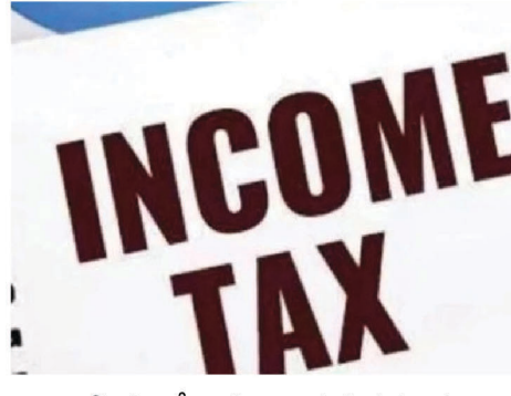
1961 స్థానంలో కొత్త ఆదాయపు పన్ను చట్టాన్ని ప్రభుత్వం అమల్లోకి తెస్తోంది. ఇందులో భాగంగా ఏప్రిల్ 1 నుంచి రాబోయే కొత్త నిబంధనలను

హైదరాబాద్ : తెలంగాణ రాజధాని హైదరాబాద్ లో ఉద్యోగం చేసేవారికి కేంద్ర ప్రభుత్వం శుభవార్త చెప్పింది. ఇంటి అద్దె భత్యం (హెచ్ఆర్ఎఫ్) మినహాయింపును 50 శాతానికి పెంచింది. ఇప్పటి వరకు ముంబై, కోల్ కతా, ఢిల్లీ, చెన్నై నగరాలను మాత్రమే మెట్రో నగరాలుగా పరిగణించేవారు. దీనితో ఆయా నగరాల్లో హెచ్ఆర్ఎఫ్ మినహాయింపు పరిమితి 50 శాతంగా ఉంటోంది. తాజాగా ఈ జాబితాలో హైదరాబాద్ తో పాటు బెంగళూరు, పుణే, అహ్మదాబాద్ చేరాయి. ఆదాయపు పన్ను నిబంధనలు, 2026 ను కేంద్రం నోటిఫై చేసింది. ఆరు దశాబ్దాల పాత ఆదాయపు పన్ను చట్టం