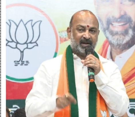
అధికారంలోకి వస్తే గత బీఆర్ఎస్, ప్రస్తుత కాంగ్రెస్ అప్పుల బాగోతాన్ని బయటకు తీసుకువచ్చి విచారణ చేపడతామని అన్నారు.

నిధులు కేటాయించాలని విద్యా శాఖ కమిషన్ ప్రతిపాదిస్తే కేవలం 8 శాతమే కేటాయించారని అన్నారు. ఆరోగ్య బడ్జెట్ కు కేటాయింపుల కంటే గత బకాయిలే ఎక్కువగా ఉన్నాయని చురక అంటించారు. దేవదాయ శాఖకు గత బడ్జెట్ లో రూ. 190 కోట్లు కేటాయిస్తే, ఈసారి ఆ ప్రస్తావన లేదని అన్నారు. పన్నెండేళ్లకు ఒకసారి వచ్చే పుష్కరాలకు కేటాయింపులు తూతూమంతంగా ఉన్నాయని ఆయన విమర్శించారు. 56 శాతం బీసీ జనాభాకు నాలుగు శాతం కేటాయింపులు విడుదలమని బండి సంజయ్ అన్నారు. రెండేళ్లలో దిగిపోయే ప్రభుత్వమే కదా అని, ఇష్టారాజ్యంగా అప్పులు చేసేందుకు సిద్ధపడ్డట్లుగా ఈ బడ్జెట్ కనిపిస్తోందని మండిపడ్డారు. బీజేపీ