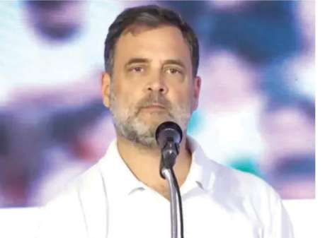
శబరిమల బంగారం చోరీపై కూడా మాట్లాడటం లేదని మండిపడ్డారు. బంగారు తాపదాలు మాయం కావడం వెనుక సీపీఐ నేతల హస్తం ఉందని ఆరోపించారు. సీపీఐతో జతకట్టడం

రాహుల్ గాంధీ కేరళలో లెఫ్ట్ కూటమి గెలుపొందాలని ప్రధాన మంత్రి నరేంద్ర మోదీ కోరుకుంటున్నారని కాంగ్రెస్ పార్టీ అగ్ర నాయకుడు రాహుల్ గాంధీ ఆరోపించారు. సీపీఐ(ఎం) వామపక్ష పార్టీ కాదని, అతివాద రైల్ వింగ్ పార్టీ అని విమర్శించారు. సిద్ధాంతాలకు వ్యతిరేకంగా లెఫ్ట్ పార్టీ నేతలు బీజేపీతో జతకట్టారని అన్నారు. అందుకే కేరళలో ఎల్ టిఎఫ్ గెలుపొందాలని మోదీ కోరుకుంటున్నారని అన్నారు. కన్నూరులో జరిగిన ఎన్నికల ప్రచారంలో ఆయన మాట్లాడుతూ, మోదీ ప్రతిపాటు మతం, దేవుడి గురించి మాట్లాడుతారని, కానీ కేరళలో మాత్రం కనీసం