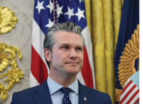
తెలిపింది. కానీ, ఆ ఈజీఎఫ్ లను మార్గాన్ స్టాన్లీ ద్వారా కొనుగోలు చేసేందుకు అప్పట్లో అవి అందుబాటులో లేకపోవడంతో ఆ పెట్టుబడుల ప్రక్రియ ముందుకు వెళ్లేదని సమాచారం. ఆ తర్వాత పీట్ హెగ్నెట్ బ్రోకర్ మరో రక్షణ రంగ కంపెనీలో పెట్టుబడులు పెట్టారా? లేదా? అనేదానిపై స్పష్టత లేదు. అయితే, యుద్ధానికి కొన్ని వారాల ముందే ఈ పరిణామాలు చోటుచేసుకోవడంతో పీట్ హెగ్నెట్ తీరుపై

పశ్చిమాసియాలో ఉద్రిక్తతలు నానాటికీ ప్రతీపమువుతోన్న వేళ అమెరికా రక్షణమంత్రి పీట్ హెగ్నెట్ కు సంబంధించి ఓ సంవత్సరం వార్షిక వినిపిస్తోంది. ఇరాన్ పై అమెరికా ఇజ్రాయెల్ సైనిక చర్య ప్రారంభానికి కొన్నివారాల ముందు హెగ్నెట్ బ్రోకర్ ఒకరు అమెరికా రక్షణ రంగానికి సంబంధించిన కంపెనీలో భారీ పెట్టుబడులు పెట్టేందుకు ప్రయత్నించినట్లు తెలుస్తోంది. ఈ మేరకు విశ్వసనీయ వర్గాలను ఉటంకిస్తూ పై నాన్ టైమ్స్ కథనం వెలువరించింది. మార్గాన్ స్టాన్లీతో కలిసి పనిచేస్తోన్న ఆ బ్రోకర్ ఈ ఏడాది ఫిబ్రవరిలో భారీ రాకెట్ ను సంబంధించినట్లు సమాచారం. భారీ రాకెట్ చెందిన డిఫెన్స్ ఇండస్ట్రీయల్స్ యాక్టివ్ ఈజీఎఫ్ టో మిలియన్ డాలర్ పెట్టుబడులు పెట్టే అవకాశాల గురించి ఆ బ్రోకర్ ఆరా తీసినట్లు సదరు కథనం వెల్లడించింది. దీనికి సంబంధించి అంతర్జాతీయంగా చర్యలు నడిచాయని సదరు వర్గాలు పేర్కొన్నట్లు