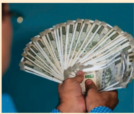
ఆయన ఒక లిఖితపూర్వక సమాధానంలో తెలిపారు. జీతాలు, అలవెన్సులు, పెన్షన్