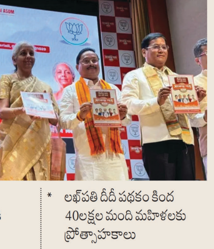
అందజేత * ఐదేళ్లలో 2 లక్షల మందికి ఉద్యోగాల కల్పన * లబ్ధి పొందిన పథకం కింద 40 లక్షల మంది మహిళలకు ప్రోత్సాహకాలు

స్థానాలు ఉన్న అస్సాంలో ఏప్రిల్ 9న పోలింగ్ జరగనుంది. మే 4న ఫలితాలు వెలువడనున్నాయి. మ్యానిఫెస్టోలోని ముఖ్యాంశాలు.. * రాజ్యాంగంలోని ఆరవ షెడ్యూల్, ఎస్సీ ప్రాంతాల మినహా.. అస్సాం అంతటా యూఎస్సీ అమలు * వరదరహిత రాష్ట్రంగా చర్యలు * బంగ్లాదేశీ మియూలు ఆక్రమించుకున్న భూములను తిరిగి స్వాధీనం చేసుకోవడం * అరుణోదయ పథకం కింద మహిళలకు నెలకు రూ.3వేలు