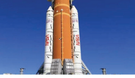
ప్రయాణిస్తుంది. చంద్రుడి సుదూర ప్రాంతం చుట్టూ తిరిగి, ఎటువంటి ఆదనపు ఇంధనం అవసరం లేకుండానే భూమికి తిరిగి వచ్చేలా 'ఫ్రీటర్న్ ట్రాజెక్టరీ'లో ఈ యాత్రను రూపొందించారు. గతంలో అపోలో 13 మిషన్ నెలకొల్పిన, భూమి నుంచి మానవులు ప్రయాణించిన అత్యంత సుదూర రికార్డును ఈ యాత్ర బద్దలు కొట్టనుంది. ఈ మిషన్ లో అత్యవసర పరిస్థితులను ఎదుర్కొనే విధానాలు, రేడియేషన్ నుంచి రక్షణ, లేజర్ ఆధారిత

ఇదే మొదటిసారి. ఈ బృందంలో నానా వ్యోమగాములు రీడ్ వైజ్ మన్, విక్టర్ గ్రోవర్, క్రిస్టినా కోకోట్ పాటు కెనడియన్ స్పేస్ విజెన్సికి చెందిన జెరెమీ హాన్సెన్ ఉన్నారు. నాసాకు చెందిన అత్యంత శక్తిమంతమైన స్పేస్ లాంచ్ వ్యూమ్ (SLS) రాకెట్ ద్వారా ఓరియన్ వ్యోమనౌకను నింగిలోకి పంపనున్నారు. ఈ యాత్రలో తొలిసారిగా మానవులతో ఓరియన్ స్పేస్ క్రాఫ్టలోని జీవనాధార వ్యవస్థలను (లైఫ్ సపోర్ట్ సిస్టమ్) పరీక్షించనున్నారు. ప్రయోగం రోజున వాతావరణం 80 శాతం అనుకూలంగా ఉంటుందని నాసా అంచనా వేస్తోంది. అయితే, మేఘాలు, గాలుల తీవ్రత సవాలుగా మారే అవకాశం ఉందని తెలిపింది.