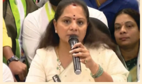
బీసీలకు అన్యాయం చేస్తూ బిల్లును ఆమోదిస్తే ఊరుకునేది లేదని తేల్చిచెప్పారు. మరోవైపు రాష్ట్రంలో పూలే విగ్రహ ఏర్పాటు విషయంలో

ఉప కోటా ఇవ్వకపోవడం అంటే పాలకులకు ఆ వర్గాల పట్ల గౌరవం లేదని అర్థమని, కేంద్రం వెన్నులో వణుకు పుట్టేలా మరోసారి పూలే పుట్టారా అన్నట్లుగా జాగృతి అధ్యక్షురాలు ఉద్ఘాటించేస్తామని ఆమె హెచ్చరించారు. పార్లమెంట్ లో ఈ నెల 16 నుంచి 18వ తేదీ వరకు మహిళా బిల్లుపై జరగనున్న చర్చా సమయంలో తాను స్వయంగా ఢిల్లీకి వెళ్లి వివిధ రాజకీయ పార్టీల నేతలను కలుసుకొని కవిత వెల్లడించారు. కేవలం మెజారిటీ ఉండన్న అహంకారంతో