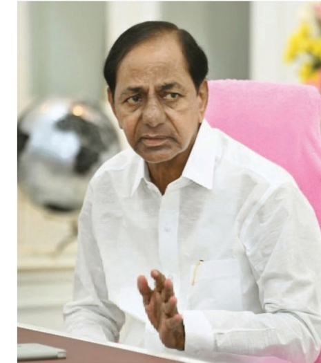
తన పట్టును మరోసారి నిరూపించుకోవాలని భావిస్తోంది.

రోడ్డు ప్రాంతాలను నిశితంగా పరిశీలించారు. ఈ బహిరంగ సభకు అత్యంత ప్రాధాన్యత ఏర్పడటానికి ప్రధాన కారణం, బీఆర్ఎస్ అధినేత కేసీఆర్ సమక్షంలో మాజీ కాంగ్రెస్ నేత, మాజీ మంత్రి జీవన్ రెడ్డి అధికారికంగా పార్టీలో చేరనుండటమే. ఈ సందర్భంగా జీవన్ రెడ్డి మాట్లాడుతూ.. తెలంగాణ గడ్డపై కేసీఆర్ తో కలిసి పనిచేసే అవకాశం రావడం తన అదృష్టమని పేర్కొన్నారు. కాంగ్రెస్ ప్రభుత్వంపై విమర్శలు గుప్పిస్తూ, గత పదేళ్ల బీఆర్ఎస్ పాలనతో పోలిస్తే ఈ రెండేళ్లలో అభివృద్ధి పూర్తిగా కుంటుపడిందని మండిపడ్డారు. రాష్ట్ర భవిష్యత్తును దృష్టిలో ఉంచుకుని కేసీఆర్ మళ్లీ అధికారంలోకి రావాలని, ప్రస్తుత రేపంత్ రెడ్డి ప్రభుత్వం పోవాలని ఆయన ఆకాంక్షించారు. ఈ భారీ సభ ద్వారా ఉత్తర తెలంగాణలో బీఆర్ఎస్