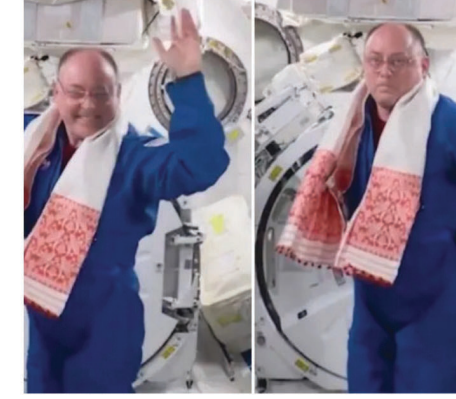
నృత్యం చేస్తున్నట్లు వీడియోలో కనిపిస్తోంది. దీన్ని అస్సాం సీఎం హిమంత పోస్ట్ చేస్తూ..

అంతర్జాతీయ అంతరిక్ష కేంద్రం (ISS) లో అమెరికాకు చెందిన ఓ వ్యోమగామి.. అస్సామీ జానపద నృత్యం 'బిహూ'ను ప్రదర్శిస్తున్నట్లు కనిపిస్తున్న ఓ వీడియో నెట్టింట్ చక్కర్లు కొడుతోంది. ఈ వీడియోను అస్సాం ముఖ్యమంత్రి హిమంత బిశ్వశర్మ 'ఎక్స్' లో పోస్ట్ చేశారు. అస్సామీ నూతన సంవత్సరానికి గుర్తుగా రాష్ట్రం 'రంగాలి బిహూ' చేసుకుంటున్న వేళ ఇది ప్రాధాన్యం సంతరించుకుంది. అమెరికన్ వ్యోమగామి మైక్ ఫింక్ సతీమణి రెనితా సైకియా అస్సామీ మూలాలకు కలిగిన మహిళా ఫింక్ తన మెడలో అస్సాం సంస్కృతికి ప్రతీక అయిన 'గమోసా' (స్కార్ఫ్) ధరించి.. ఐఎస్ఎస్ లో బిహూ