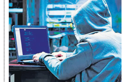
మొత్తం రూ. 150 కోట్ల మేర మోసాలు జరిగినట్లు పోలీసులు నిర్ధారించారు.

మంది బ్యాంకు అధికారులు, 15 మంది మ్యూజ్ ఖాతాదారులు, ఐదుగురు మీడియేటర్లు ఉన్నారు. నేరగాళ్లతో కుమ్మక్కైన బ్యాంకు అధికారులు.. అక్రమంగా వారికి ఖాతాలు తెరిచి ఇచ్చినట్లు పోలీసులు గుర్తించారు. ఈ ఆపరేషన్ లో 16 ప్రత్యేక బృందాలు పాల్గొన్నాయి. దర్యాప్తులో విస్తృత అంశాలు వెలుగులోకి వచ్చాయి. బాధితుల సొమ్మును దారి మళ్లించేందుకు నేరగాళ్లు ఏకంగా 350 బ్యాంకు ఖాతాలను వినియోగించినట్లు గుర్తించారు. ఈ ఖాతాలకు దేశవ్యాప్తంగా నమోదైన సుమారు 850 సైబర్ కేసులతో సంబంధం ఉన్నట్లు గుర్తించారు.