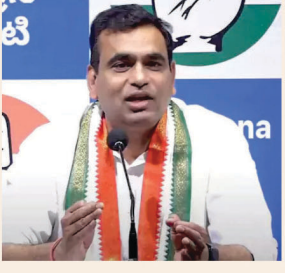
మహిళల పట్టించుకోవద్దని కోరారు. 'మహిళా రిజర్వేషన్లకు కాంగ్రెస్