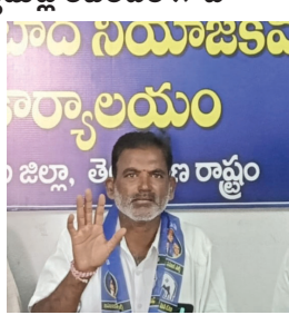
జి.ఎస్.ఎస్. నియోజకవర్గ ఇన్స్టాల్డ్ పబ్లిక్ వర్క్స్ కమిషన్ గౌడ్

* జి.ఎస్.ఎస్. నియోజకవర్గ ఇన్స్టాల్డ్ పబ్లిక్ వర్క్స్ కమిషన్ గౌడ్ హుస్సాబాద్, ప్రజాస్వామి: గత నాలుగు రోజుల క్రితం హుస్సాబాద్ పువసాయ మార్కెట్ కు దానున్న తీసుకోవచ్చి ధాన్యం ఆరబోస్తున్న రైతు నెమలికొండ ఒడయ వడదెబ్బ తగిలి అస్పష్ట గుర్తిచోపిట్టల్ లో మృతి చెందడం జరిగింది. మృతి చెందిన రైతు కుటుంబాన్ని ప్రభుత్వం ఆదుకోవాలని హుస్సాబాద్ నియోజకవర్గ బిఎస్సీ ఇన్స్టాల్డ్ పబ్లిక్ వర్క్స్ కమిషన్ గౌడ్ ప్రభుత్వాన్ని కోరారు. ఒడయ తీసుకొచ్చిన వడ్డు ఇంకా హుస్సాబాద్ మార్కెట్ యార్డు ఆవరణలోనే ఉన్నాయని నిబంధనల ప్రకారం వడ్డు తేమశాతం రావడానికి మూడు రోజులు ఎండలో ధాన్యం ఆరబోస్తూ తీవ్ర అస్పష్ట గుర్తిచోపిట్టల్ లో జరిగిందని జరిగిందని జరిగిందని ఆయన అన్నారు. ఆయన భార్య కూడా తీవ్ర అనారోగ్యంతో బాధపడుతున్నారని, మార్కెట్ ఆవరణలో చనిపోతే రైతుకు నిబంధన ప్రకారం ఐదు లక్షల ఇన్సూరెన్స్ ఇవ్వవలసి ఉంటుంది ఈ విషయంలో మంత్రి పొన్నం ప్రభాకర్, మార్కెట్ చైర్మన్ పాలకవర్గం యుద్ధ ప్రాతిపదికన ఆ రైతు కుటుంబాన్ని ఆదుకోవాలని బిఎస్సీ పార్టీ పక్షాన డిమాండ్ చేశారు ఇప్పటికీ హుస్సాబాద్ లో మార్కెట్ యార్డులో కాకుండా మిగతా రెండు సెంటర్లలో ఒక్క శాతం వడ్డు కొనలేని పరిస్థితి ఏర్పడిందని ఒకవైపు అకాల వరాలు కురిసే అవకాశం కనబడుతున్న ప్రభుత్వం ఏమాత్రం పట్టించుకోవడం లేదని ఆవేదన వ్యక్తం చేశారు.