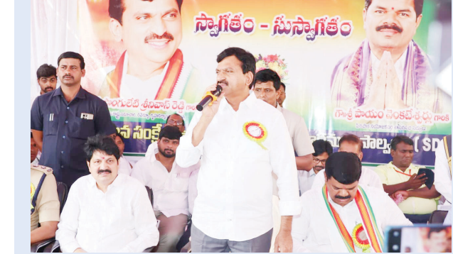
ప్రజాస్వామి, కొత్తగూడెం: ప్రజా ప్రభుత్వం ఏర్పడిన తర్వాత విద్యారంగానికి అత్యంత ప్రాధాన్యత ఇస్తున్నామని రాష్ట్ర రెవెన్యూ, గృహ నిర్మాణ, సమాచార, పౌర సంబంధాల శాఖ మంత్రి పొన్నలెటి శ్రీనివాస్ రెడ్డి అన్నారు. పేదవారి పిల్లలు కూడా దునికల పిల్లలతో సమానంగా చదువుకోవాలని ప్రభుత్వం కంకణం కట్టుకుందని, ప్రభుత్వ పాఠశాలలు, రెసిడెన్షియల్ విద్యాసంస్థలను ప్రైవేట్ పాఠశాలలకు ధీటుగా అభివృద్ధి చేస్తున్నామని చెప్పారు. విద్య పట్ల ప్రభుత్వం చూపుతున్న నిబద్ధతకు అనేక నిదర్శనాలు ఉన్నాయని వివరించారు. మణుగూరు మండలం లోక మల్లారం గ్రామంలో గురువారం భద్రాచలం జిల్లా పరిధిలోని బీటీ రహదారి పనులకు శంకుస్థాపన చేసి, టీటీఆర్.ఎస్ బాలికల కార్యాలయ హాల్ ను ప్రారంభించారు. తొలుత రూ.1 కోటి అంచనా వ్యయంతో ప్రధాన బీటీ రహదారి నుండి పాఠశాల వరకు అప్రోచ్ బీటీ రహదారి నిర్మాణ పనులకు మంత్రి శంకుస్థాపన చేశారు. అనంతరం శ్రీనివాస్ రెడ్డి మాట్లాడుతూ ఇటీవలే రూ.2.70 కోట్ల వ్యయంతో బాలికల వసతి గృహాన్ని ప్రారంభించామని పేర్కొన్నారు. పేద కుటుంబాలకు చెందిన పిల్లలు కూడా మంచి ఆహారం తీసుకుంటూ, మెరుగైన విద్యను అభ్యసించాలనే ఆశయంతో ప్రభుత్వం హాస్టళ్లలో ఉన్న బాలబాలికలకు నాణ్యమైన భోజనాన్ని అందిస్తోందన్నారు. ఇంటి వద్ద తల్లిలు చేసే వంటల రుచిని గుర్తు చేస్తూ పోషకాహారంతో కూడిన మెనును అమలు చేస్తున్నామని తెలిపారు. ప్రతి రోజూ అందించే ఆహారం విషయంపై స్పష్టమైన ప్రణాళికతో హాస్టళ్లలో సకల సౌకర్యాలు కల్పిస్తూ విద్యార్థుల అభివృద్ధికి కృషి చేస్తున్నామని చెప్పారు. ఈ ప్రభుత్వం పేద విద్యార్థుల భవిష్యత్తుపై పూర్తి విశ్వాసంతో ఉందని, వారు తమ కాళ్ల మీద నిలబడి దేశాన్ని, ప్రపంచాన్ని శాసించే స్థాయికి ఎదిగగలరని చదువుతున్నామని పేర్కొన్నారు. ఆర్థిక పరిస్థితులు కారణంగా ఎవరికీ చదువు ఆగిపోకుండా అన్ని వసతులు కల్పిస్తున్నామని చెప్పారు. వైద్య రంగంలో కూడా పేదవారికి ఎలాంటి ఇబ్బందులు కలగకముందే ప్రభుత్వం ప్రత్యేక శ్రద్ధ తీసుకుంటోందన్నారు. కుటుంబంలో ఎవరికైనా అనారోగ్యం కలిగితే ఆర్థికంగా ఇబ్బందులు పడకుండా ప్రభుత్వ ఆసుపత్రులను బలోపేతం చేసి, నాణ్యమైన వైద్య సేవలను అందిస్తున్నామని చెప్పారు. ఈ సందర్భంగా పాఠశాలలో పదో తరగతి, ఇంటర్మీడియట్లో శాతం వంద ఫలితాలు సాధించినందుకు ప్రెసిడెంట్, సిబ్బందిని రాష్ట్ర ప్రభుత్వ తరఫున అభినందించారు. అనంతరం పినపాక శాసనసభ్యులు పాఠశాల వెంకటేశ్వర్లు, భద్రాచలం శాసనసభ్యులు తెల్లం వెంకటరావు, జిల్లా కలెక్టర్ అంకిత, జిల్లా ఎస్.పి. రోహిత్ రాజు, ఐటీడీఏ ప్రాజెక్ట్ అధికారి రామారావు మాట్లాడారు. ఈ కార్యక్రమంలో భద్రాచలం సబ్ కలెక్టర్ మృణాళి శ్రేష్ట, గ్రామ సర్పంచ్ పూనె రమేష్, పాఠశాల ప్రెసిడెంట్ రాజ్, ప్రజా ప్రతినిధులు, విద్యార్థులు, ఉపాధ్యాయులు, తదితరులు పాల్గొన్నారు.