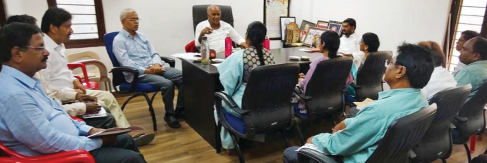
కారణంగా బిల్లులు నిలిచిపోకుండా అధికారులను ఆదేశించారు. గురువారం కొత్తగూడెంలోని ఎమ్మెల్యే క్యాంపు కార్యాలయంలో గృహనిర్మాణ శాఖ మండల స్థాయి అధికారులు, మున్సిపల్ కార్పొరేషన్ అధికారులతో ఏర్పాటు చేసిన సమీక్షా సమావేశంలో ఆయన మాట్లాడారు. వివిధ దశలలో అభివృద్ధి పొందిన ఇండ్లను త్వరితగతిన పూర్తి చేయాలని ఆయన కోరారు. యూనివర్సిటీలో నిర్వహిస్తారని, అలాంటి కార్యక్రమం మన పాఠశాలలో నిర్వహించుకోవడం ఉండదని ఉండవచ్చు. విద్యార్థులు ఉన్నత చదువులు చదవడానికి ఇది ఇన్సైన్సైటివ్ గా ఉండవలసి తెలిపారు. ప్రైవేట్ పాఠశాలలకు ధీటుగా తమ

* సమీక్షా సమావేశంలో శాసనసభ సభ్యులు కూననేని సాంబశివరావు ప్రజాస్వామి, కొత్తగూడెం: ఇందిరమ్మ ఇండ్ల నిర్మాణాలను నిర్వహించిన గడువులోగా త్వరితగతిన పూర్తి చేయాలని కొత్తగూడెం శాసనసభ సభ్యులు కూననేని సాంబశివరావు అధికారులను ఆదేశించారు. గురువారం కొత్తగూడెంలోని ఎమ్మెల్యే క్యాంపు కార్యాలయంలో గృహనిర్మాణ శాఖ మండల స్థాయి అధికారులు, మున్సిపల్ కార్పొరేషన్ అధికారులతో ఏర్పాటు చేసిన సమీక్షా సమావేశంలో ఆయన మాట్లాడారు. వివిధ దశలలో అభివృద్ధి పొందిన ఇండ్లను త్వరితగతిన పూర్తి చేయాలని ఆయన కోరారు. యూనివర్సిటీలో నిర్వహిస్తారని, అలాంటి కార్యక్రమం మన పాఠశాలలో నిర్వహించుకోవడం ఉండదని ఉండవచ్చు. విద్యార్థులు ఉన్నత చదువులు చదవడానికి ఇది ఇన్సైన్సైటివ్ గా ఉండవలసి తెలిపారు. ప్రైవేట్ పాఠశాలలకు ధీటుగా తమ