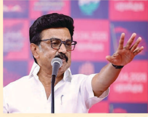
తృణమూల్ కాంగ్రెస్ కూటమికి 100 సీట్లు (11+/-) రాజ్ పుచ్చని పేర్కొంది. ఇతరులకు 02

స్థానంలో నిలవచ్చుంది. ఓట్ల శాతం పరంగా చూస్తే డీఎంకే కూటమికి 39 శాతం, టీపీకేకు 30 శాతం, అన్నాడీఎంకే కూటమికి 27 శాతం ఓట్లు రాజ్ పుచ్చని (3 శాతం అటూఇటుగా) అంచనా వేసింది. పశ్చిమ బెంగాల్ లో భాజపాకే అవకాశం! ఉత్తరంగా సాగిన పశ్చిమ బెంగాల్ పోరులో భాజపాకు విజయవకాశాలు ఉన్నాయని టుడేస్ చాణక్య సర్వే సంస్థ అభిప్రాయపడింది. 294 స్థానాలకు గానూ 192 స్థానాలు (11+/-) ఆ పార్టీకి రాజ్ పుచ్చని అంచనా వేసింది.