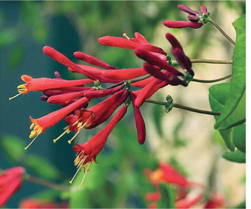
వీటిని దూరం చేయడానికి ఫంగిసైడ్ తో పాటు వేపనూనె పిచికారీ చేయవచ్చు. దానికంటే ముందుగా వ్యాధినోకిన