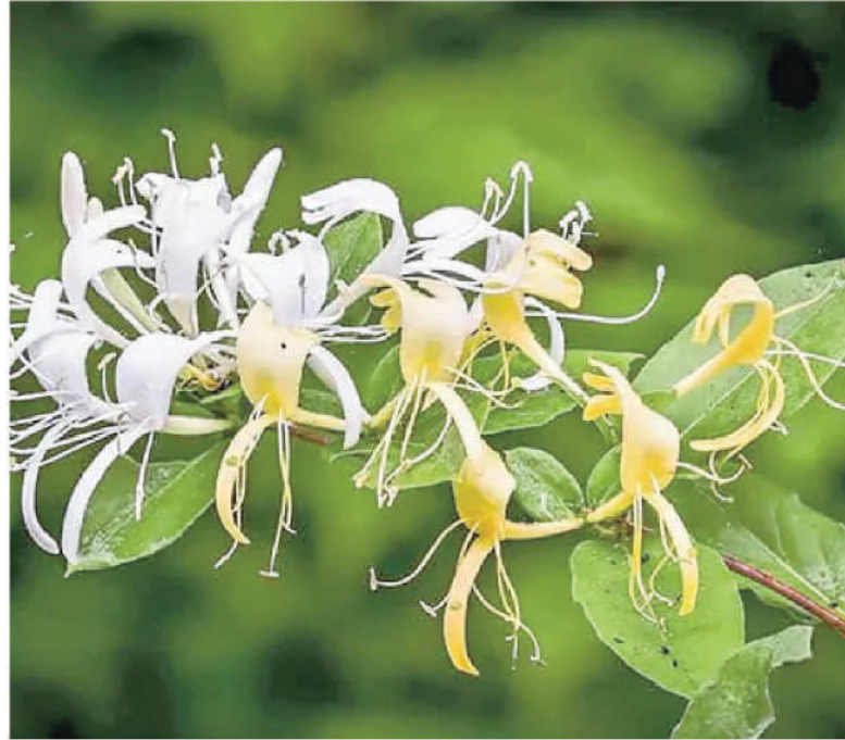
కొమ్మలను తొలగించడం వల్ల కొత్త చిగుళ్లు వచ్చి పూలు ఎక్కువగా పూస్తాయి. ఏడాదికి రెండుసార్లు కంపోస్ట్ లేదా

కాలంలో ఈ పూలను ప్రేమకు, విశ్వాసానికి చిహ్నంగా, పెళ్లిలో వధువు ఈ పూలను పెట్టుకోవడం శుభ సూచకంగా నూ భావించేవారట. అందుకేనే మో... షేక్స్ పియర్ వంటి ప్రముఖ కవుల రచనల్లో ఈ పూల ప్రస్తావన ఎక్కువగా కనిపిస్తుంది. తేమ అవసరమే కానీ... ఈ మొక్కకు రోజుకు కనీసం 6 నుంచి 8 గంటల పాటు ఎండ అవసరం. ఎండ తక్కువైతే పూలు తక్కువగా పూస్తాయి. నీరు నిల్వ ఉండని సారవంతమైన నేలలు దీనికి అనుకూలం. ఇవి తీగ జాతి మొక్కలు కాబట్టి, పొకడానికి గోడలు, ఫెన్సింగ్ లేదా ట్రెల్లిస్ వంటి ఆధారాల్ని కల్పించాలి. మొక్క నాటిన కొత్తలో క్రమం తప్పకుండా నీరు పెట్టాలి. ఎదిగిన తర్వాత నేల పైపొర ఆరిపోయినప్పుడు మాత్రమే నీరు పోయాలి. వేర్ల దగ్గర తేమ ఉండాలి కానీ నీరు నిలిచిపోకూడదు. శీతకాలం చివరలో లేదా వసంతకాలం మొదట్లో మొక్కను కత్తిరించాలి. ఎండిపోయిన