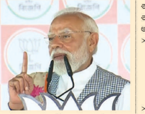
స్థానాలు రాజ్ పుచ్చని పేర్కొంది. భాజపాకు 48 శాతం ఓటింగ్ (3 శాతం +/), తృణమూల్ కు 38

శాతం (3 శాతం +/), ఇతరులకు 14 శాతం (3 శాతం +/). ఓటింగ్ రాజ్ పుచ్చని టుడేస్ చాణక్య అభిప్రాయపడింది. > ఇక కేరళలో అధికార ఎల్ డీఎఫ్, యూడీఎఫ్ మధ్య గట్టి పోటీ ఉండబోతోందని టుడేస్ చాణక్య అంచనా వేసింది. అయితే, యూడీఎఫ్ కే ఎడ్వే ఉందని అభిప్రాయపడింది. 140 స్థానాలకు గానూ 69 (9+/-) రాజ్ పుచ్చని పేర్కొంది. > అస్సాంలో 50 శాతం ఓట్లు, 102 సీట్లతో భాజపా భారీ విజయం అందుకోబోతోందని పేర్కొంది.