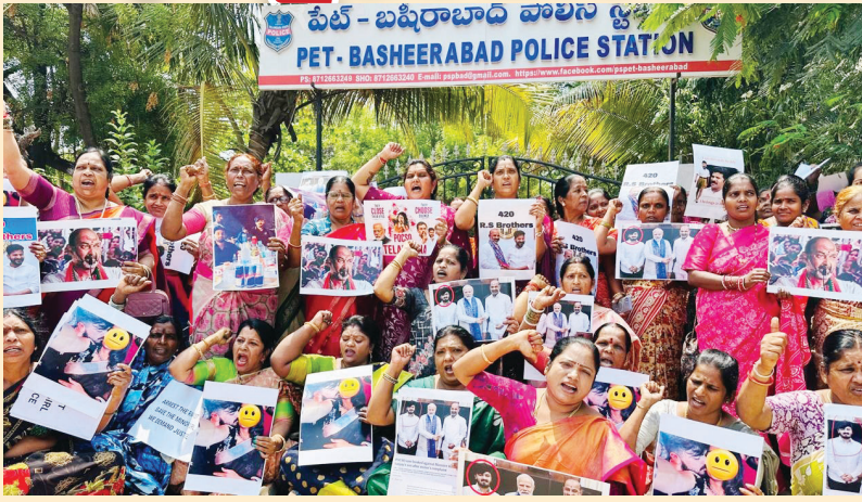
పేట్ - బషీరాబాద్ పాలిస్ స్టేషన్