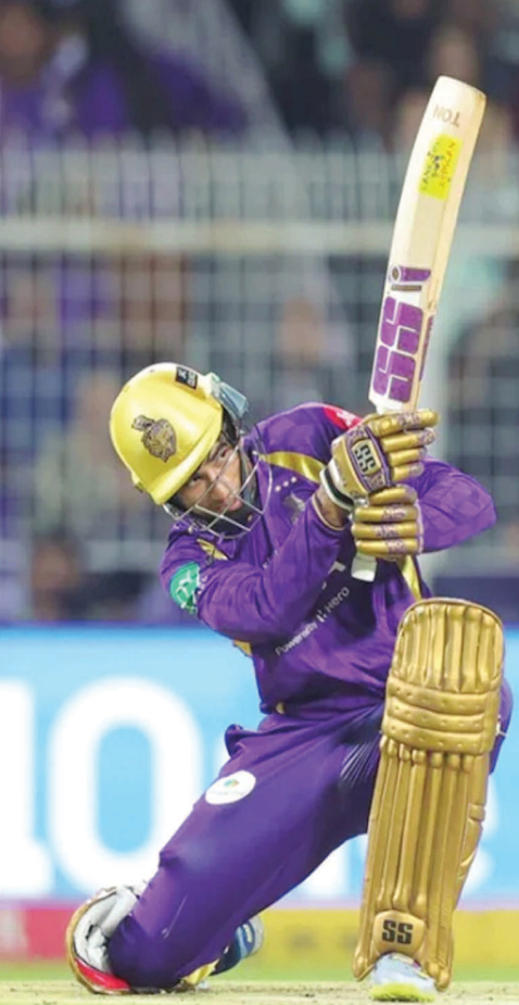
బెట్యూడు. అలెన్ బెట్యూనా రఘువంశీ జతగా గ్లీన్ (52 నాటోల్) దండయా. డెత్ ఓవర్లో వీరధర్ విద్యంసంతో కోల్కతా నిర్ణీత ఓవర్లలో 2 వికెట్లు నష్టానికి 247 పరుగులు కొట్టింది.

కోల్కతాను ఆదిలోనే దెబ్బకొట్టాడు నికాంత్. ఓపెనర్ రహనే(14)ను బౌల్డ్ చేసి గుజరాత్కు ప్రేక్షకులను ఆ తర్వాత ఫిన్ అలెన్(93) రెవైవ్ చేశారు. రహనే ఖాన్ ఓవర్లో తొలి మూడు బంతుల్ని స్టాంప్ చేసి కంపాడు. 14, 33 పరుగుల వ్యక్తిగత స్కోర్ వద్ద బ్రెక్ లాభించడంతో అర్ధ శతకం బానిస రఘువంశీ(82 నాటోల్)తో కీలక భాగస్వామ్యం నెలకొల్పాడు. షోర్లర్లను రెండు సిక్సర్లతో అరుసుకోగా 9 ఓవర్లకు స్కోర్ వంద అయింది. తుఫాన్ ఇన్వింగ్స్ ఆడిన అలెన్ 12వ ఓవర్లో సిక్సర్ కొట్టడం బౌండరీ దగ్గర రహనే క్యాచ్ పట్టగా