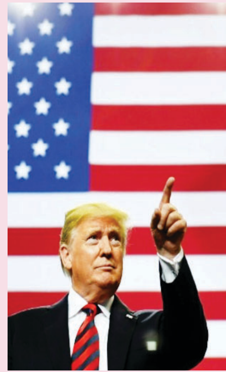
అమెరికా చైనా భాగస్వామ్య దేశాలుగా ఉండాలి తప్ప.. ప్రత్యర్థులుగా కాదని జిన్సింగ్ పేర్కొనడం గమనార్హం.

న్యూ యార్క్: తైవాన్ అంశంపై అమెరికా అధ్యక్షుడు డోనాల్డ్ ట్రంప్ కీలక వ్యాఖ్యలు చేశారు. అది తమకు కచ్చితమైన సమస్యనని వెల్లడించారు. భౌగోళికంగా ఆ ప్రాంతం తమకు చాలా దూరంలో ఉందని, వారి స్వాతంత్ర్యం కోసం మేం పోరాడబోమని వ్యాఖ్యానించారు. "తైవాన్ అంశం క్లిష్టమైన సమస్య. ఈ ద్వీపం.. చైనాకు కేవలం 95 కిలోమీటర్ల దూరంలో, అమెరికాకు మాత్రం 15 వేల కిలోమీటర్ల దూరం దూరంలో ఉంది. ఎక్కువ దూరం కావడంతో మేం వేగంగా స్పందించడం కష్టమే. చైనా చాలా శక్తిమంతమైన, పెద్ద దేశం. ఉద్రిక్తతల విషయంలో చైనా, తైవాన్ లు సంయమనం పాటించాలి" అని ఓ వార్తాసంస్థతో ట్రంప్ అన్నారు. వారి స్వాతంత్ర్యం ఆకాశంపై కోసం అంతదూరం ప్రయాణించి మేం యుద్ధం చేయాలని అనుకోవడం లేదన్నారు. చైనా పర్యటన అనంతరం ట్రంప్ ఈ వ్యాఖ్యలు చేయడం ప్రాధాన్యం సంతరించుకుంది. తైవాన్ సమస్యను సరిగ్గా పరిష్కరించకపోతే.. అమెరికా చైనా మధ్య ఘర్షణ తలెత్తే ప్రమాదం ఉందని ట్రంప్ తనకు జిన్సింగ్ స్పష్టం చేసినట్లు వార్తలు వచ్చిన సంగతి తెలిసింది. ఈ నేపథ్యంలో