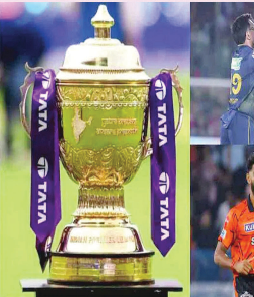
మెరుగు ఉన్న జట్లు క్యాలిఫర్నీ 1కు దూసుకెళ్తుంది.

న్యూఢిల్లీ: ఐపీఎల్ పంతోమ్మిలో సీజన్ ప్లే ఆఫ్ రేసు ఉత్తర రేపుతోంది. నాకాట్ పోటీలో లేని జట్లు పోకాపోకూ టాప్ లోని జట్లకు షాకిస్తుండడంతో సమీకరణాలు మారిపోతున్నాయి. నాలుగు బెరులకు ఎనిమిది జట్లు పోటీలో నిలవగా.. లీగ్ దశలో 11 మ్యాచులే మిగిలాయి. ఈ పరిస్థితుల్లో ముందంజ వేయాలంటే.. ప్రతి మ్యాచ్ చాంపియన్. ఈ నేపథ్యంలో టాప్-2లోని గుజరాత్ బ్రెటాస్, రాయల్ ఛాలెంజర్స్ కు ఒక్క విజయం చాలు. కానీ, సన్ రైజర్స్ హైదరాబాద్, రాజస్థాన్ రాయల్స్, పంజాబ్ కింగ్స్ రెండింటా గెలవాలి ఉంటుంది. అయితే.. చెన్నై సూపర్ కింగ్స్, కోల్కతా, ఢిల్లీ క్యాపిటల్స్ భారీ టెడతో గెలవడమే కాకుండా ఇతర మ్యాచ్ ల ఫలితాల ఆధారంగా ప్లే ఆఫ్ రేసు చేరే అవకాశముంది.