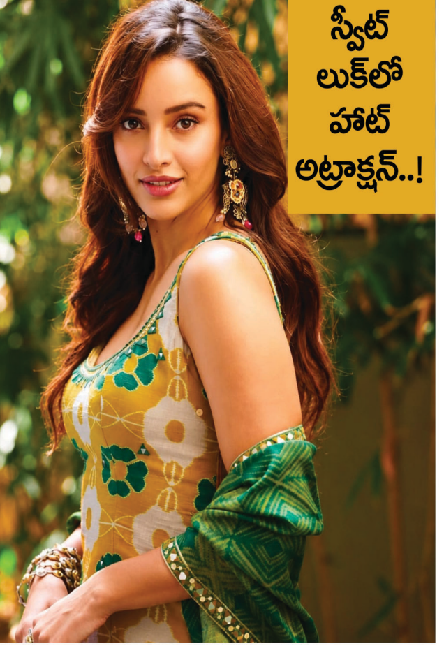
స్వీట్ లుక్లో హాట్ అట్రాక్షన్..!