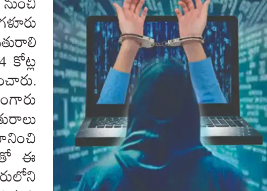
వారి ఖాతాలకు బదిలీ చేశారు. అక్కడితో ఆగని మోసగాళ్లు.. మరింత నగదు కోసం నేరగాళ్లు డిమాండ్ చేశారు. దీంతో తన వద్ద ఉన్న దాదాపు 1.3 కిలోల బంగారు ఆభరణాలను తాకట్టు పెట్టేందుకు బాధితురాలు బ్యాంకుకు వెళ్లారు. అయితే, ఈ మధ్య ఆమె ఖాతా నుంచి భారీ మొత్తంలో నగదు లావాదేవీలు జరుగుతున్నట్లు

డిజిటల్ అరెస్ట్ పేరుతో ఓ వృద్ధురాలి నుంచి రూ.కోట్లు కాజీసిన సైబర్ నేరగాళ్లను బెంగళూరు సైబర్ క్రైం పోలీసులు అరెస్టు చేశారు. బాధితురాలి నుంచి ఇప్పటివరకు దాదాపు రూ.24 కోట్ల నగదును నేరగాళ్లు దోచుకున్నట్లు గుర్తించారు. సైబర్ కేటుగాళ్లకు చెల్లించేందుకు బంగారు ఆభరణాలు తాకట్టు పెట్టేందుకు బాధితురాలు బ్యాంకుకు వెళ్లగా.. సిబ్బంది అనుమానించి పోలీసులకు సమాచారం ఇవ్వడంతో ఈ వ్యవహారం వెలుగుచూసింది. బెంగళూరులోని (Bengaluru) శివాజీనగర్ కు చెందిన ఓ వృద్ధురాలికి (74) ఇటీవల ఆన్ లైన్ విక్రయించడం ద్వారా భారీ మొత్తంలో నగదు సమకూరింది. ఈ విషయాన్ని పసిగట్టిన సైబర్ నేరగాళ్లు.. మనీ లాండర్స్ కేసు పెడతామంటూ ఆమెను బెదిరించడం మొదలుపెట్టారు. దీంతో భయాందోళనలకు గురైన ఆమె.. జనవరి నుంచి మే నెల మధ్య కాలంలో దాదాపు రూ.24 కోట్లను