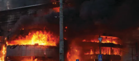
దూసుకెళ్తుంది. ఈ క్షిపణి అణు వార్ హెడ్ లను మోసుకెళ్లగలదు. యూరేన్ లోని అన్ని దేశాలు ఈ క్షిపణి పరిధిలోకి వస్తాయని, దీన్ని అడ్డుకునే సామర్థ్యం గల ఆయుధమేదీ లేదని రష్యా గతంలో ప్రకటించింది. తొలిసారిగా దీనిని 2024 నవంబరులో ఉక్రెయిన్ నగరమైన డినిపోలోని ఓ ప్యాక్షరీ

వొలాదిమిర్ జెలెన్స్కీ తీవ్రంగా మండిపడ్డారు. సాధారణ పౌరులే లక్ష్యంగా రష్యా భారీ డ్రోన్లు, క్షిపణి దాడులకు తెగబడిందని.. అందులో శక్తిమంతమైన హైపర్ సోనిక్ 'ఒరెషిక్' క్షిపణులను ప్రయోగిస్తోందని ఆరోపించారు. అయితే, దీనిపై ఇప్పటి వరకు రష్యా స్పందించలేదు. ఓమిటీ ఒరెషిక్ క్షిపణి..? ఒరెషిక్ అనేది హైపర్ సోనిక్ బాలిస్టిక్ క్షిపణి. రష్యా అత్యాధునిక క్షిపణిలో ఒకటైన ఈ మిస్సైల్.. గంటకు 13,000 కిలోమీటర్ల వేగంతో ప్రయాణించగలదు. అంటే ధ్వని వేగం కంటే 10 రెట్లు వేగంగా