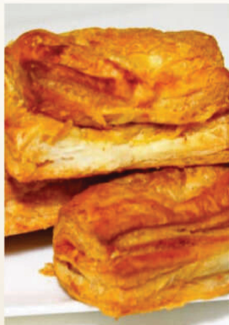
ఆలూ మటర్ పఫ్ కావాల్సినవి