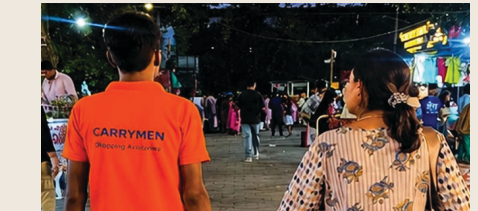
కాకపోతే టీవీలు వేసుకోరంతే' అంటూ మరో వ్యక్తి రాసుకొచ్చారు. 'ఈ ఫ్లాట్ ఫామ్ కమిషన్ పోసు ఈ పని చేసే కార్యక్రమాలకు చేతికి ఎంత దక్కతుందో' అంటూ ఓ వ్యక్తి ఆందోళన వెలిబుచ్చారు. 'మానవ వనరులను ఇలాంటి వాటికి ఉపయోగించడం సరైనదేనా?' అంటూ మరొకరు ప్రశ్నిస్తున్నారు.

కూలోనిలో వడం పంటి పనులు కూడా చేస్తారు ఈ సంస్థ సిబ్బంది. ఇందుకు గానూ గంటకు రూ. 149 తీసుకుంటారు. బేబీ క్యారియర్, మొబైల్ ఛార్జింగ్, గొడుగు, మడత కుర్చీ వంటి సేవలను కూడా అందిస్తున్నారు. దీనికి అదనంగా చెల్లించాలి. అయితే, ఈ సేవలపై సామాజిక మాధ్యమాల్లో భిన్నాభిప్రాయాలు వ్యక్తమవుతున్నాయి. 'మా అమ్మకు ఈ విషయం తెలిస్తే నా ఫ్లేస్ లో వీరిని పెట్టేసుకుంటుంది' అంటూ ఒకరు సరదాగా కామెంట్ చేయగా.. 'భర్త ఉండగా.. ఈ కారీమెన్ ఎందుకు?' అంటూ మరొకరు ఫస్ట్ గ్లాస్ కామెంట్ చేశారు. 'మా ఊర్లోనూ ఇలాంటి సేవలున్నాయి..