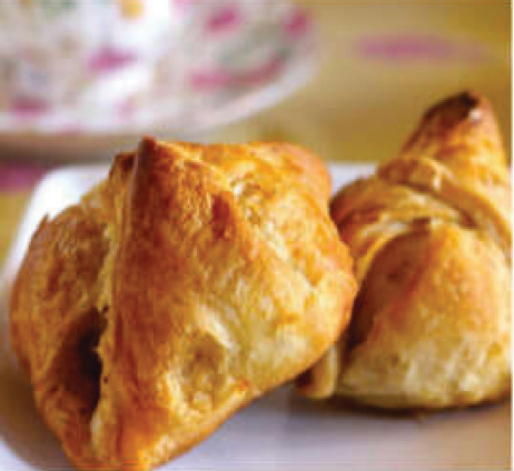
ఎగ్ పఫ్ కావాల్సినవి

వానకాలంలో చిరుతిళ్లు తినడం బాగా ఎంజాయ్ చేస్తారు. అయితే, అలాగని బయటి వుడ్ తింటే ఆరోగ్యం పాడవుతుంది ఎలాగా? అని ఆలోచిస్తుంటారు. అయితే, బయట దొరికే వుడ్ ని ఇలా ఇంట్లోనే ఈజీగా చేసుకోండి.