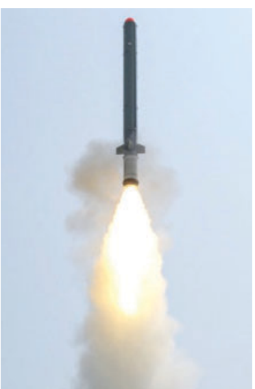
అభినందించిన రక్షణ మంత్రి రాజ్ నాథ్ సింగ్